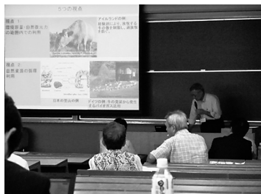
写真1 SATOYAMA イニシアティブに関する講演の様相

まず、愛知目標における個別目標11の保護地域のカバー率についての議論が紹介された。日本は、生物多様性が高いが危機に瀕している地域として、世界に34か所ある生物多様性ホットスポットのひとつに挙げられており、世界平均以上の取組が国内